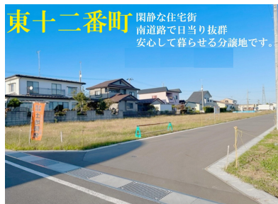
東十二番町 閑静な住宅街 南道路で日当たり抜群 安心して暮らせる分譲地です。